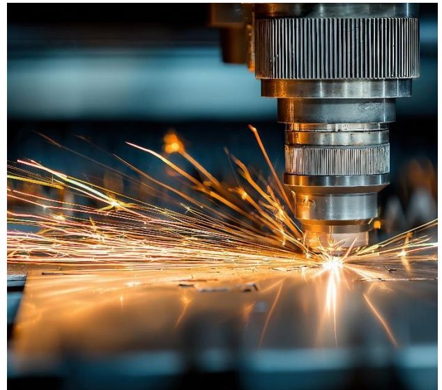
Laserschneidmaschine bei der Metallbearbeitung

Der österreichische Markt bietet deutschen Unternehmen im Bereich Photonik attraktive Geschäftsmöglichkeiten, insbesondere durch die steigende Nachfrage nach innovativen Lösungen für die industrielle Produktion. Unternehmen investieren gezielt in Technologien zur Effizienzsteigerung, Qualitätssicherung sowie zur Digitalisierung und Automatisierung von Fertigungsprozessen. Konkrete Einsatzfelder ergeben sich insbesondere in der laserbasierten Materialbearbeitung, der optischen Messtechnik sowie in der Prozessüberwachung und industriellen Sensorik. Auch im Kontext von Smart Manufacturing und datenbasierten Produktionssystemen wächst der Bedarf an leistungsfähigen, integrierbaren Lösungen.