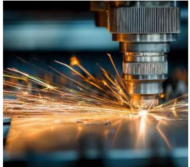
Laserschneidmaschine bei der Metallbearbeitung

Der österreichische Markt bietet deutschen Unternehmen im Bereich Photonik attraktive Geschäftsmöglichkeiten, insbesondere durch die steigende Nachfrage nach innovativen Lösungen für die industrielle Produktion. Unternehmen investieren gezielt in Technologien zur Effizienzsteigerung, Qualitätssicherung sowie zur Digitalisierung und Automatisierung von Fertigungsprozessen. Konkrete Einsatzfelder ergeben sich insbesondere in der laserbasierten Materialbearbeitung, der optischen Messtechnik sowie in der Prozessüberwachung und industriellen Sensorik. Auch im Kontext von Smart Manufacturing und datenbasierten Produktionssystemen wächst der Bedarf an leistungsfähigen, integrierbaren Lösungen.